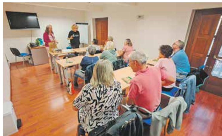
Foto: Los alumnos de ajedrez han podido profundizar en este juego-arte-ciencia. CDC

Dirigidos a personas adultas y mayores interesadas en seguir aprendiendo a lo largo de la vida,