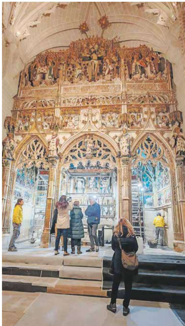
Foto: El I simposio internacional Bartolomé Bermejo combinó la reflexión académica con la experiencia directa del patrimonio. Patrimonio Daroca

La inauguración oficial, celebrada en la Fundación Campo de Daroca, contó con la interven-