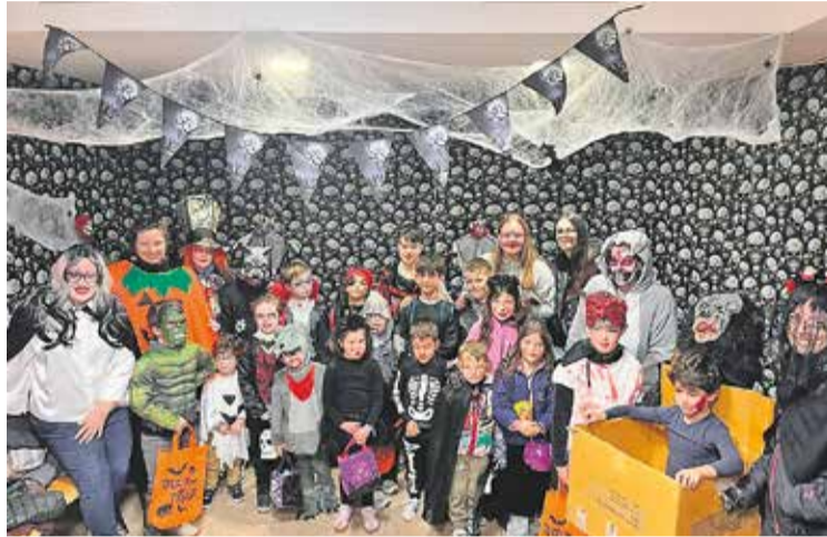
Foto: Truco o trato en Mainar.