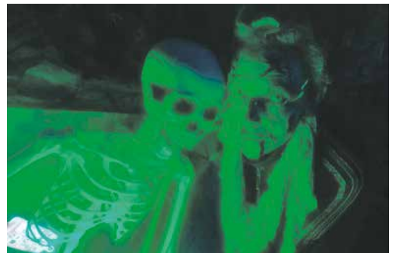
Foto: En Torralba de los Frailes se toman muy en serio la decoración. Asociación de Torralba de los Frailes