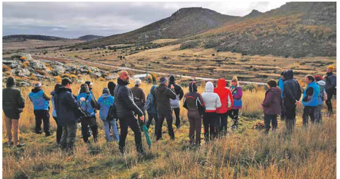
Foto: La fiesta de bienvenida, una cita imperdible para los amantes de la naturaleza. Amigos de Gallocanta.