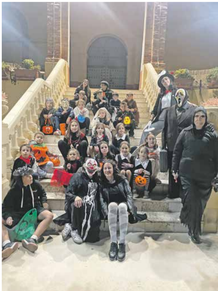
Foto: Grandes y pequeños lo pasaron de miedo en Murero. Asociación Cultural San Mamés