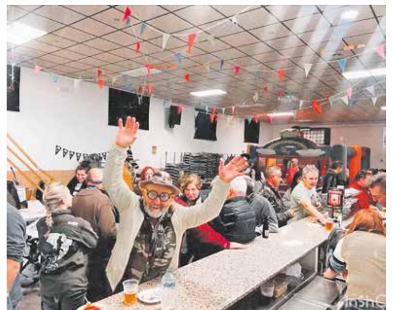
Foto: En Aldehuela de Liestos se vivió una auténtica fiesta. ADL en fiestas