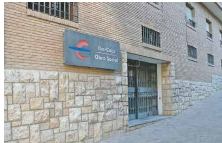
Foto: El nuevo centro ocupará la antigua Casa del Jubilado. Comarca Campo de Daroca

La Comarca Campo de Daroca ha anunciado la creación de un futuro Centro de Juventud en el local del antiguo Hogar del Jubilado de Daroca, una iniciativa que pretende ofrecer un espacio específico para adolescentes y jóvenes, un sector que hasta ahora carecía de propuestas estables de ocio y participación. La inversión total asciende a 60.000 euros, de los cuales 40.000 se han destinado a la adquisición del inmueble y 20.000 a la redacción del proyecto necesario para su puesta en marcha.