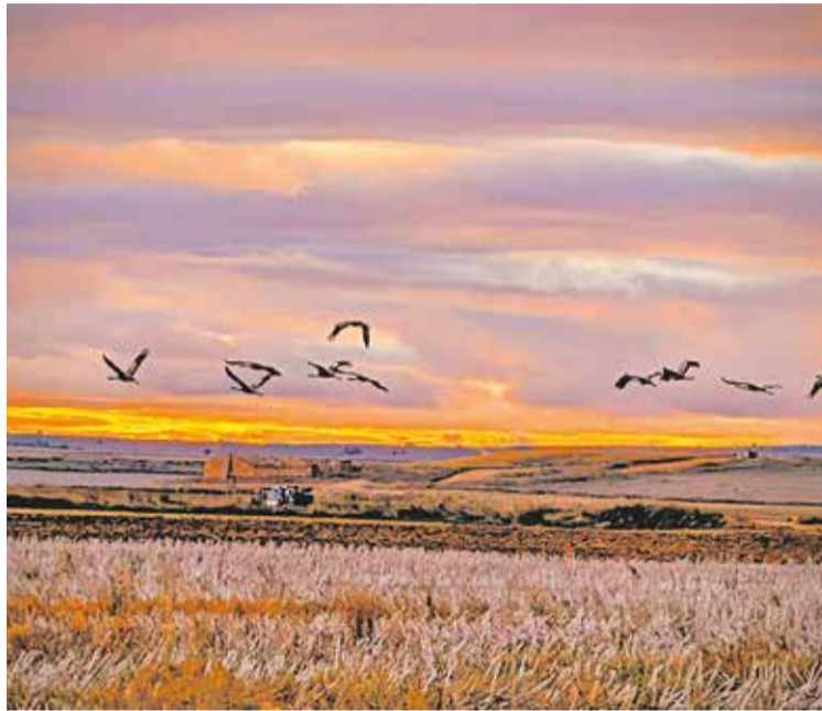
Foto: Grullas despertando en Gallocanta.