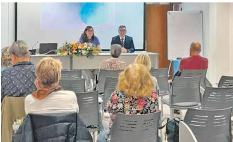
Día de la inauguración del curso de Japón.

La Comarca de Daroca celebrará en diciembre la clausura de los cursos de ajedrez y de cultura japonesa impartidos este cuatrimestre dentro del programa UNED Sénior, fruto de la cola-