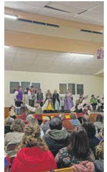
Foto: Actuación del Grupo Folclórico Darocense. Comisión de Fiestas de Villadoz.