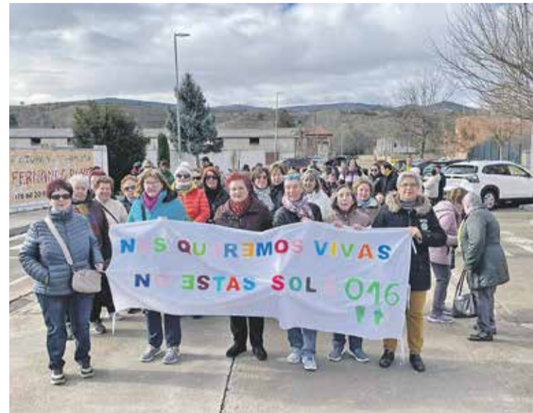
Foto: Las mujeres de la Asociación La Carra portando la pancarta.

El programa culminó el martes 25 de noviembre con un acto institucional en Daroca en el que la comunidad se unió para condenar firmemente la violencia machista. En el CEIP Pedro Sánchez Ciruelo tuvo lugar una gran concentración que continuó con una marcha hasta el monolito del 25N donde se llevó a cabo la lectura de los diferentes manifiestos de la Asociación de mujeres "La Carra", alumnos del IES Comunidad de Daroca, Comarca y Ayuntamiento, que pusieron voz al compromiso colectivo.