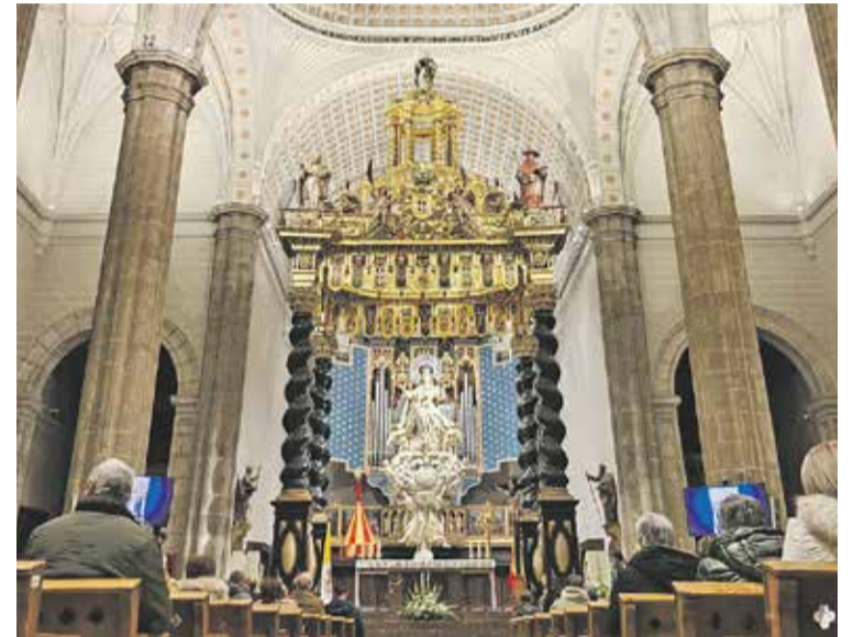
Foto: El resultado de la limpieza del baldaquino ha superado las expectativas. UPD.

El sábado 22 de noviembre pudimos admirar el sorprendente resultado de la limpieza y restauración del baldaquino de la Basílica de Santa María de los Sagrados Corporales que ha superado todas las expectativas.