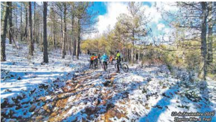
Foto: El hielo obligó a replantear la ruta en bici. Deportes Daroca

Herrera de los Navarros vivió el sábado 22 de noviembre una vibrante jornada deportiva con una nueva quedada de la Ibérica Bike & Trail, que logró reunir a 25 amantes de la BTT y 30 corredores de montaña dispuestos a disfrutar del territorio pese al ambiente invernal.