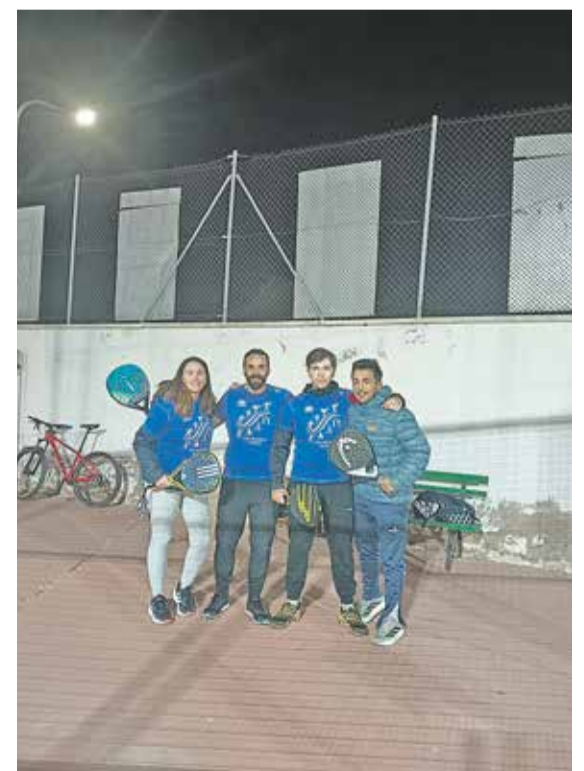
Foto: Los usuarios lucen orgullosos sus nuevas camisetas técnicas. Deportes Daroca