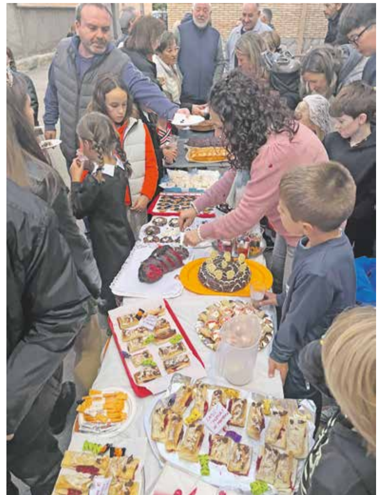
Foto: Delicias otoñales en Murero.