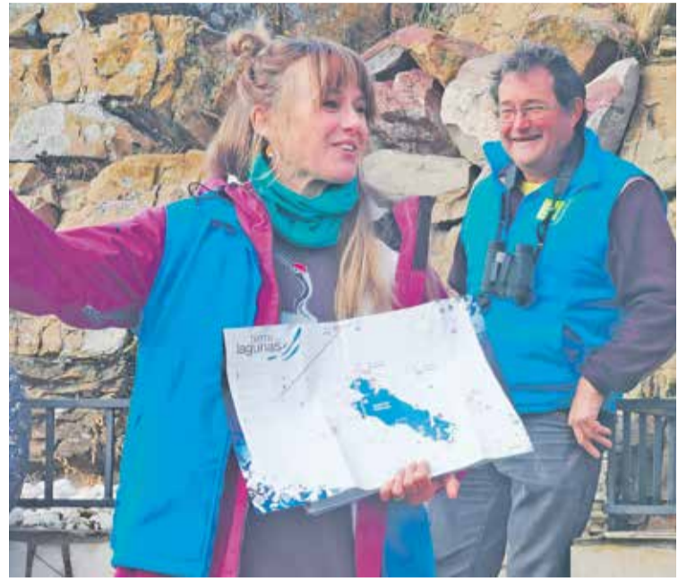
Foto: La jornada es un a oportunidad para aprender sobre el terreno. Amigos de Gallocanta.