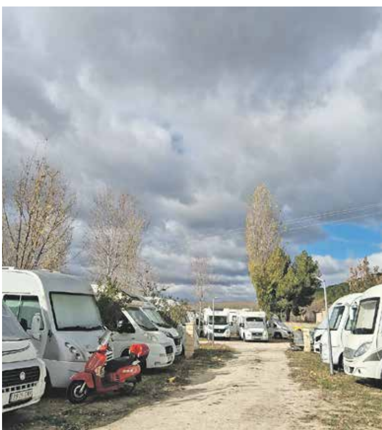
Foto: 82 autocaravanas se dieron cita en el Camping Daroca. Camping Daroca