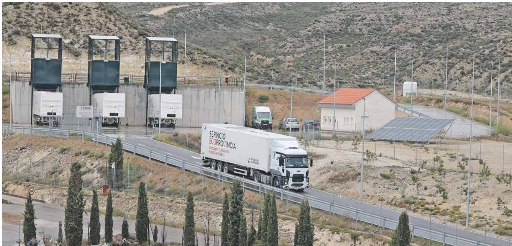
Foto: La basura del Campo de Daroca se lleva a la planta de transferencia de Calatayud (en la imagen) y desde allí se transporta al centro de tratamiento de Zaragoza.

DESDE SU PUESTA EN MARCHA EN 2023, ESTE SERVICIO DE LA DIPUTACIÓN DE ZARAGOZA HA GESTIONADO MÁS DE 165.000 TONELADAS DE RESIDUOS, 5.500 DE ELLAS EN LOS MUNICIPIOS DEL CAMPO DE DAROCA