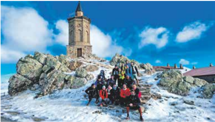
Foto: Éxito de participación en esta jornada de deporte al aire libre. Deportes Daroca