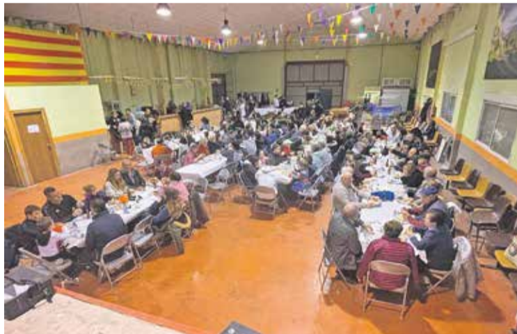
Foto: Lo mejor de las actividades es la convivencia. Asociación de Torralba de los Frailes