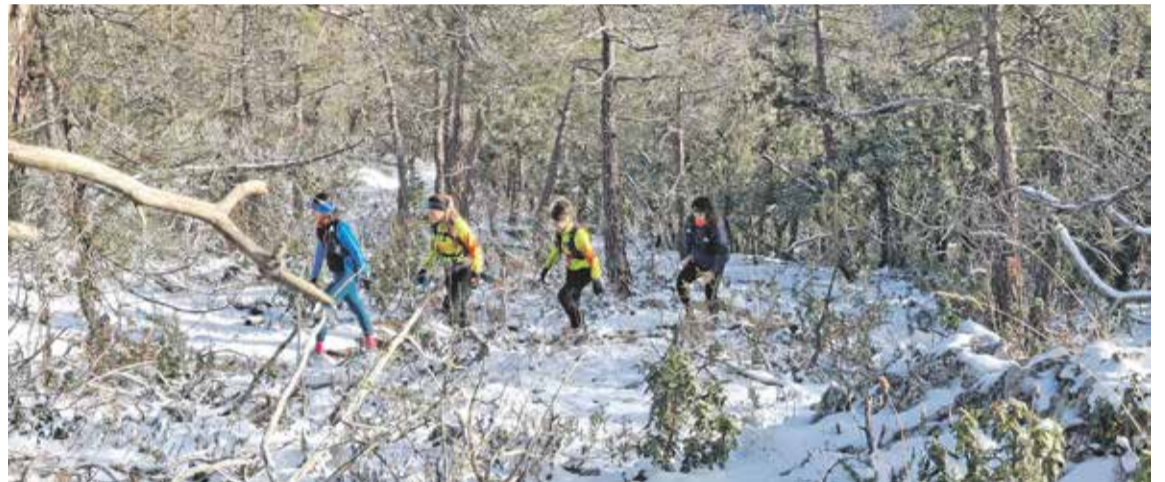
Foto: Los corredores de montaña, encantados con la nieve. Deportes Daroca