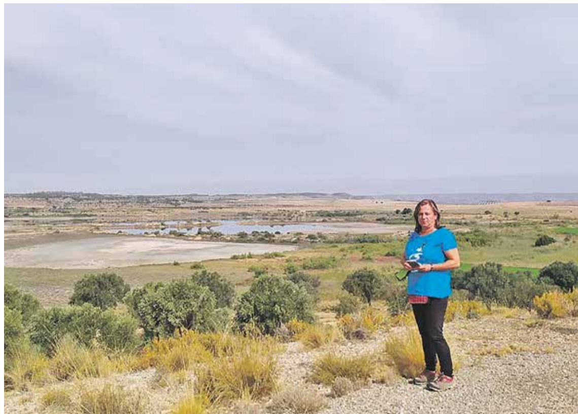
Foto: Carmen Ballestín. Consejería de Medio Ambiente Comarca Campo de Daroca

Sí. Urbaser presta actualmente el servicio, pero estamos preparando el nuevo concurso público. La Ley 7/2022 de Residuos y Suelos Contaminados obliga a ampliar y modernizar los sistemas de recogida, incorporando nuevas fracciones como textil, aceite usado y biorresiduos (orgánico). El nuevo contrato permitirá actualizar el servicio, mejorar rutas e infraestructuras y gestionar de manera más eficiente todas las fracciones.