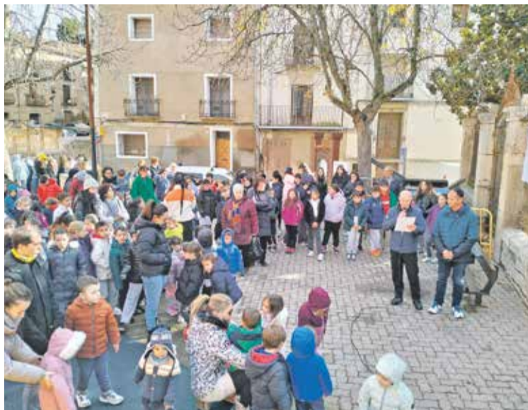
25N Día Internacional para la Eliminación de la Violencia contra la Mujer.