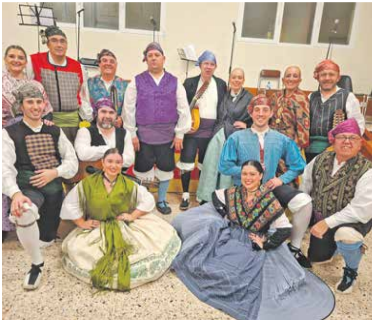
Foto: Actuación del Grupo Folclórico Darocense en Villadoz.

La Comarca Campo de Daroca continúa reforzando su apuesta por la cultura de proximidad con una nueva edición del Banco de Actividades, un programa que vuelve a demostrar su capacidad para dinamizar la vida social de los municipios también en los meses más tranquilos del año. Tras un verano especialmente intenso, en el que numerosos ayuntamientos incorporaron este catálogo a sus programaciones festivas, resulta significativo que varios consistorios hayan decidido seguir destinando recursos a mantener la oferta cultural una vez finalizada la época estival. Este impulso permite ampliar el formato que el pasado año se