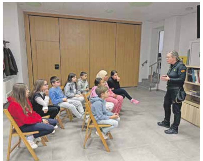
Foto: Los alumnos de Villarreal de Huerva muy atentos durante la presentación.