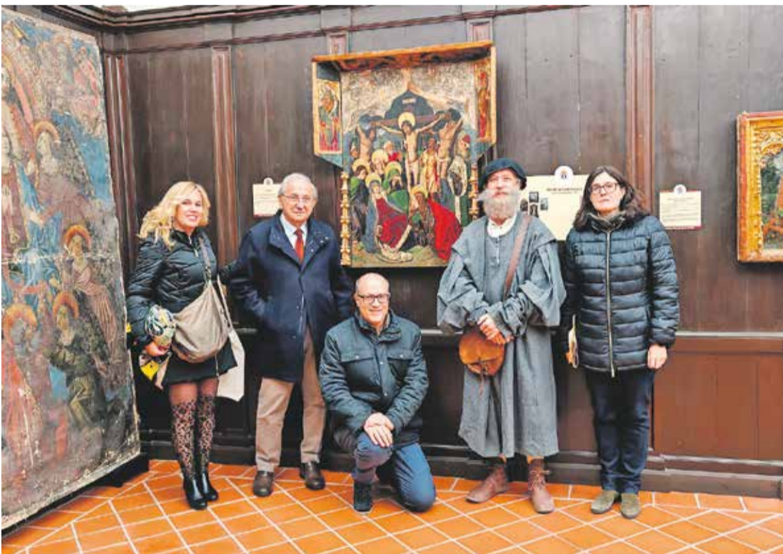
El propio Bartolomé Bermejo posó junto a miembros de la Delegación Italiana y la Consejería de Patrimonio durante el Simposio.

Daroca se convirtió los días 20 y 21 de noviembre en el punto de encuentro internacional en torno a la figura de Bartolomé Bermejo con la celebración del I Simposio Internacional que lleva su nombre, un evento organizado por la UNED de Calatayud y la Consejería de Patrimonio Cultural y Tradiciones Populares de la Comarca del Campo de Daroca