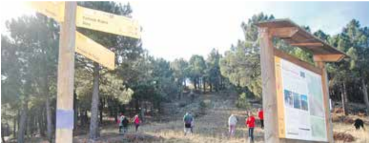
Foto: El Pinsapar de Orcajo es uno de los bosques singulares más emblemáticos del territorio. Medio Ambiente Daroca

El segundo baño de bosque del ciclo organizado por la Comarca del Campo de Daroca se celebró en el singular Pinsapar de Orcajo, un enclave poco conocido para muchos de los participantes, entre los que destacaron vecinos llegados desde la Comunidad de Calatayud y Zaragoza. Este creciente interés demuestra el valor que están adquiriendo estas experiencias de conexión pausada con la naturaleza.