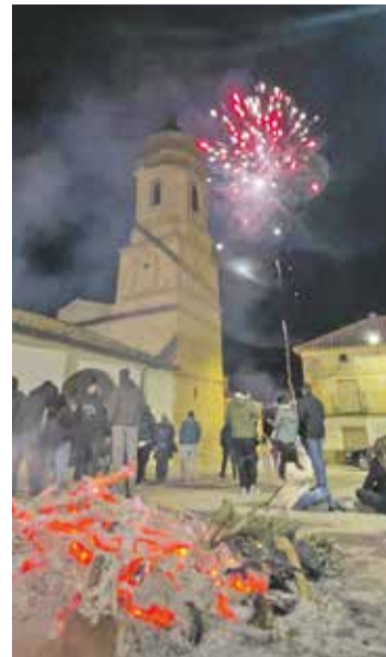
Foto: No faltó la hoguera ni los fuegos artificiales. Comisión de Fiestas de Villadoz.