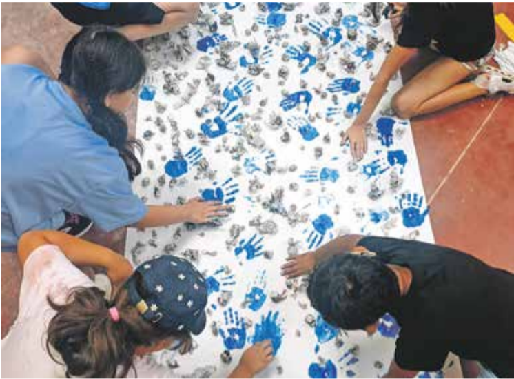
Foto: Regresan los espacios infantiles y juveniles de la Comarca. Juventud Comarca de Daroca

“El final del verano llegó,...”, decía la canción. En la Comarca Campo de Daroca, el cierre de la temporada estival se traduce en alguna que otra buena nueva, como, por ejemplo, la reapertura de las ludotecas, la Casa de Juventud y el Espacio Joven, los servicios promovidos por las Consejerías de Bienestar Social y de Juventud de la Institución.