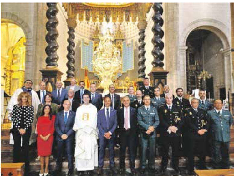
Foto: Celebración de la Merced en la Basilica de Santa María de los Corporales. UP Daroca

Daroca y el Centro Penitenciario se unieron, una vez más, en la celebración de la Fiesta de Nuestra Señora de la Merced, la patrona de cárceles e instituciones penitenciarias y de los cautivos.