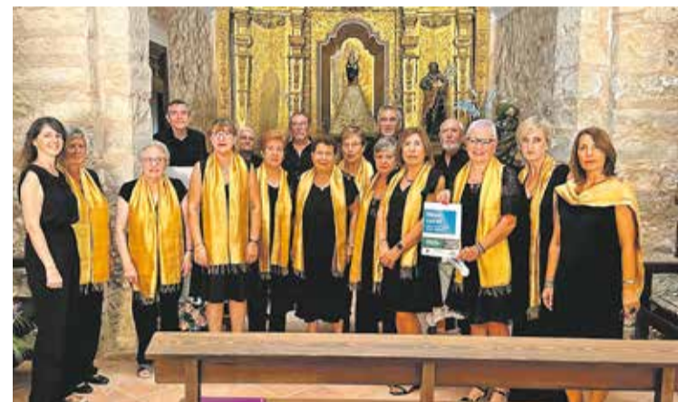
Foto: Coral Darocense Ángel Mingote.

La Coral Darocense Ángel Mingote está a punto de comenzar un nuevo curso. Como siempre en sus más de 50 años de historia, la agrupación sigue abierta a nuevas incorporaciones y, en este sentido, ha querido lanzar un mensaje a la población del territorio.