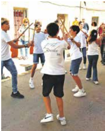
Representación del Palotiau Pirenaico, en Las Cuerlas.

● La congregación eligió a la localidad, a la que le une la devoción y la tradición en torno a Santa Orosia, para celebrar el 25º Aniversario de su renacimiento