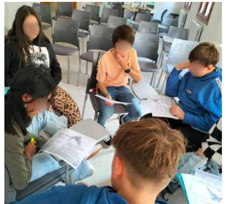
Foto: Consejeros y consejeras del CIA del Campo de Daroca. Rubén Sanz