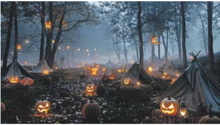
Foto: Llega Halloween a Torralba de los Frailes.

Con un siniestro y escalofriante vídeo y un mensaje contundente, “¡Corre!”. Así anunciaron la Comisión de Fiestas y la Asociación Cultural de Mujeres de Torralba de los Frailes el inicio de los preparativos para la noche