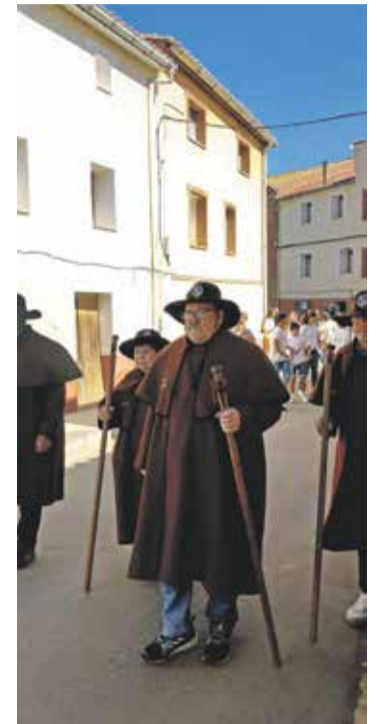
Foto: Procesión de los Devotos de la Hermandad de Romeros de la Cabeza de Santa Orosia, en Las Cuerlas. AC Las Cuerlas