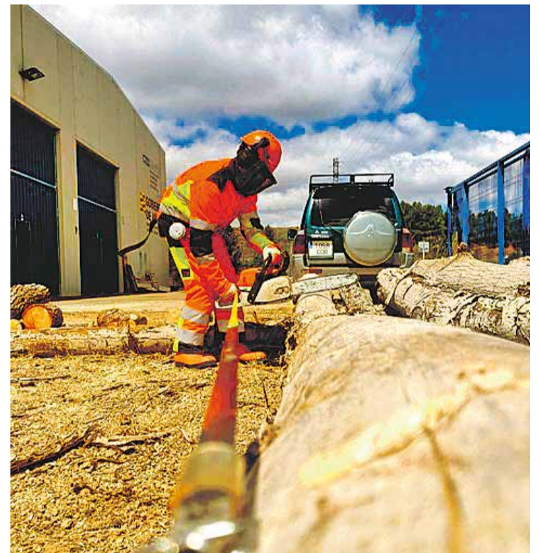
Foto: Curso de Motosierra ECC1 en el Centro de Formación Forestal. Centro de Formación Forestal