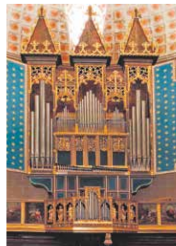
Foto: Órgano de la Basílica de Santa María de los Corporales. Patrimonio Cultural de Aragón