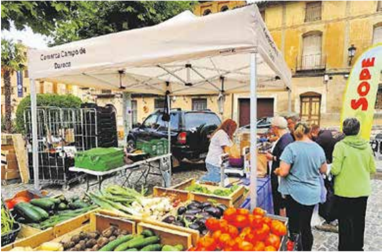
Foto: Las carpas de la Comarca Campo de Daroca en el Mercado Daroca Km0. Turismo Comarca de Daroca

Con el inicio de la gestión del nuevo Programa Leader, que gestiona ADRI, se ha puesto en marcha el trámite para que los emprendedores de las Comarcas del Jiloca y el Campo de Daroca puedan solicitar ayudas para sus proyectos en las convocatorias anuales que se van a publicar durante los años 2024, 2025 y 2026.