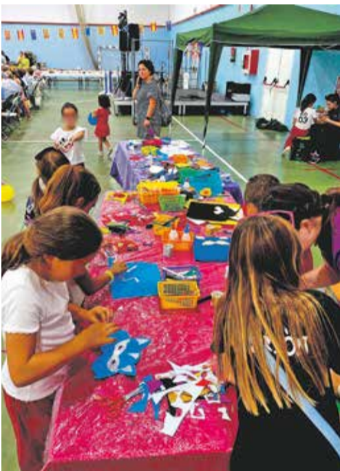
Foto: Los más pequeños protagonizaron algunos de los actos más divertidos de las Fiestas.