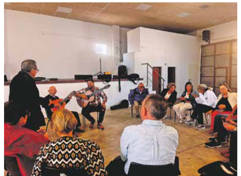
Masterclass de Jota Aragonesa, en Mainar.