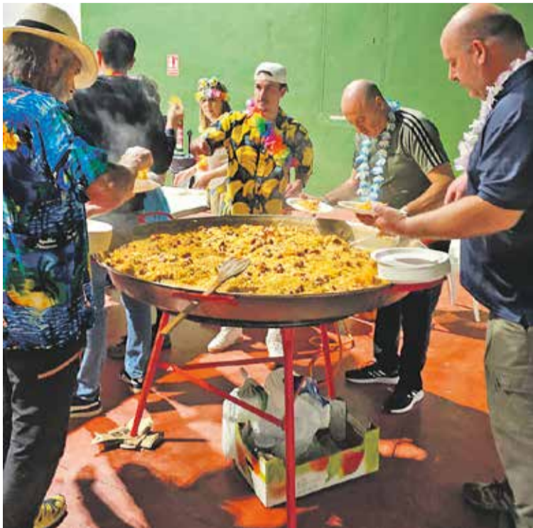
Foto: La organización preparó una estupenda fideuá. Comisión de Manchones