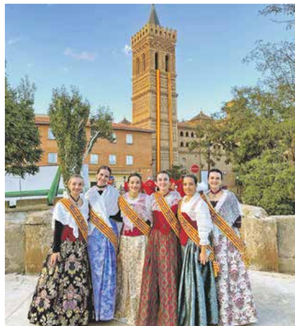
Foto: Las Majas 2024 de Herrera de los Navarros. Fiestas Herrera FB