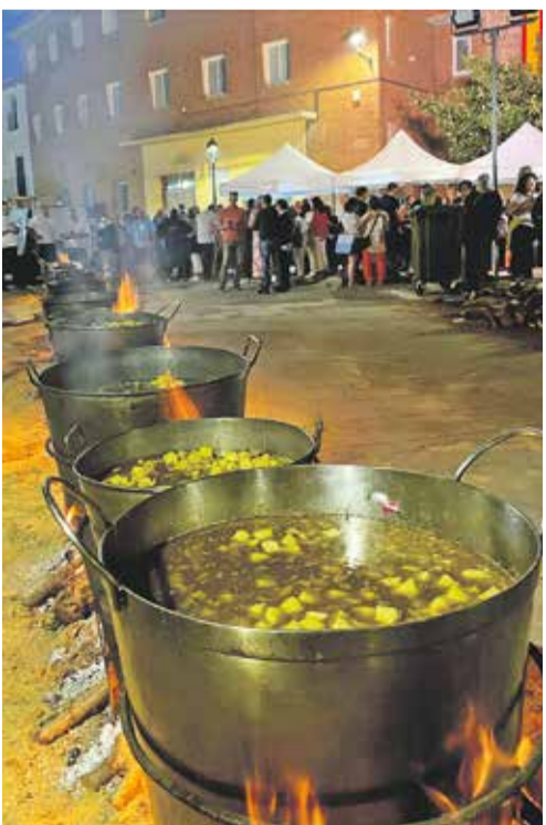
Foto: Tradicional cena del toro.