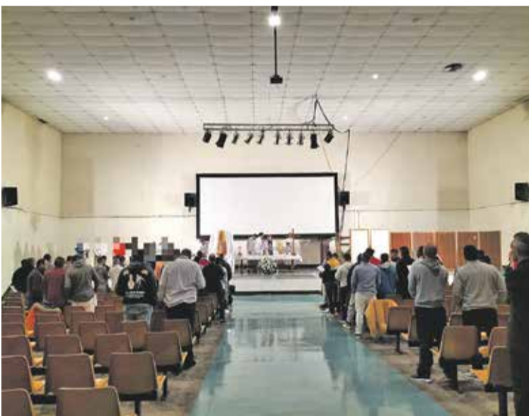
Foto: Celebración de la Merced en el Centro Penitenciario. UP Daroca

● El arzobispo de Zaragoza, Carlos Escribano, participó en la eucaristía que se llevó a cabo en el Centro