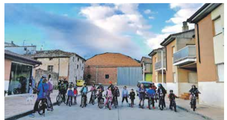
Foto: Los alumnos y alumnas del CEIP San Jorge, de Herrera de los Navarros, en su llegada al colegio. CEIP San Jorge