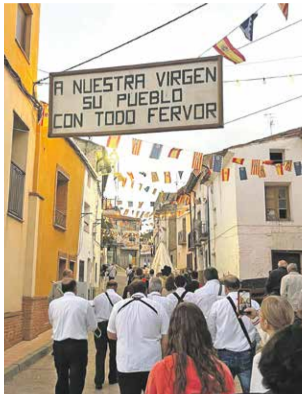
Foto: Procesión en honor a la Virgen de la Sierra. Fiestas Herrera FB