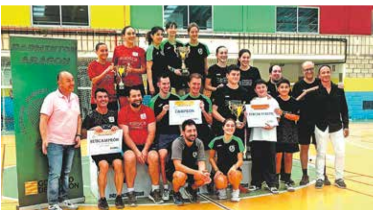
Foto: Foto de familia en el Campeonato de Bádminton. Club de Bádminton de la Comarca de Daroca

A finales de agosto, una delegación de jugadores y entrenadores del Club de Bádminton Comarca de Daroca, en colaboración con VV Osca, realizó un viaje a Dinamarca, uno de los países más innovadores del bádminton europeo. El objetivo principal del viaje fue preparar la pretemporada, conocer de cerca los métodos de entrenamiento de alto nivel y participar en una competición oficial. Los resultados fueron positivos, y tanto los jugadores como los