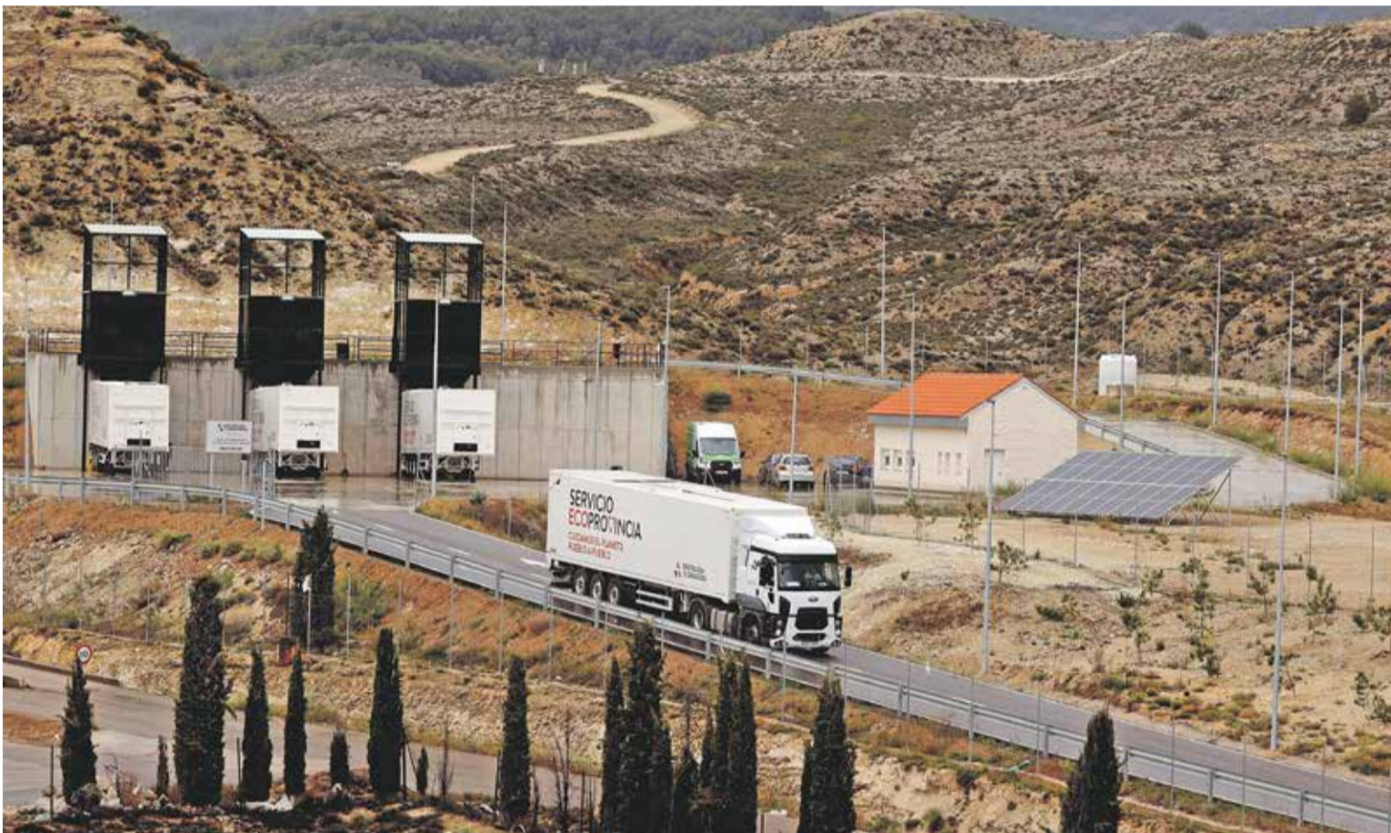
Foto: Planta de transferencia de Calatayud, donde llevan sus residuos los ayuntamientos del Campo Daroca para luego ser transportados a Zaragoza. DPZ

El servicio Ecoprovincia de la Diputación de Zaragoza acaba de cumplir un año reciclando la basura del contenedor verde en los más de 250 municipios adheridos. Desde su puesta en marcha ya ha gestionado y transportado más de 84.000 toneladas de residuos.