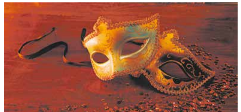
Foto: Máscaras venecianas.