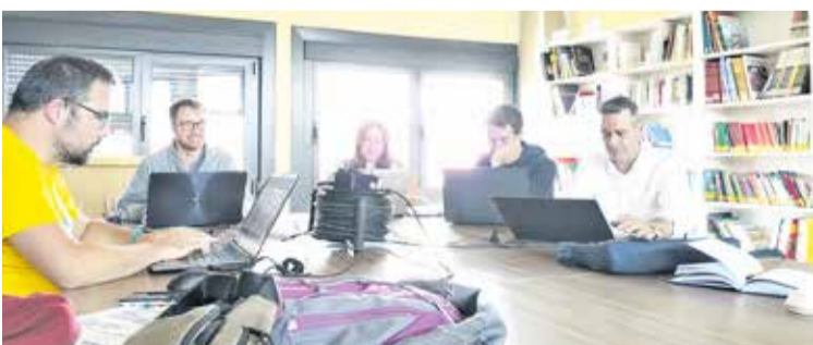
Foto: Jornadas de Coordinación del Dpto. de Juventud, en Badules. Juventud Comarca de Daroca

La Consejería de Juventud de la Comarca Campo de Daroca se reunió, a principios de septiembre, en Badules, para celebrar