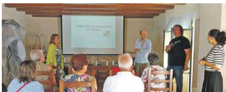
Foto: Charla 'Compras seguras por Internet', en Torralbilla.