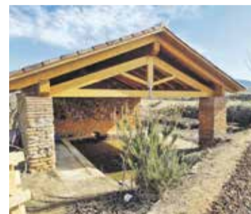
Lavadero de Villarreal de Huerva.

El Ayuntamiento de Villarreal de Huerva ha concluido la rehabilitación del antiguo lavadero, una obra que recupera un espacio emblemático para la localidad. Este proyecto, financiado con 25.000 euros a través del Plan Unificado de Subvenciones -PLUS- de la Diputación Provincial de Zaragoza, ha permitido devolver el esplendor a una infraestructura que forma parte del patrimonio histórico y cultural del municipio.