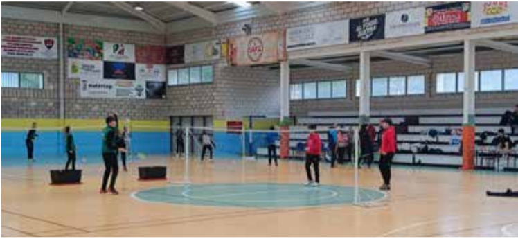
Jornada de tecnificación en Daroca.