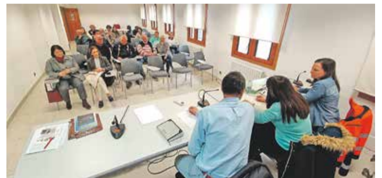
Foto: Constitución del Consejo de Salud de la Zona Básica de Daroca. Consejo de Salud de Daroca

El pasado 27 de marzo, la sede de la Comarca Campo de Daroca acogió una reunión extraordinaria del Consejo de Salud de la Zona de Daroca, en la que se analizó la propuesta de cierre del Punto de Atención Continuada (PAC) de Used, incluida en un documento elaborado por los sindicatos médicos.