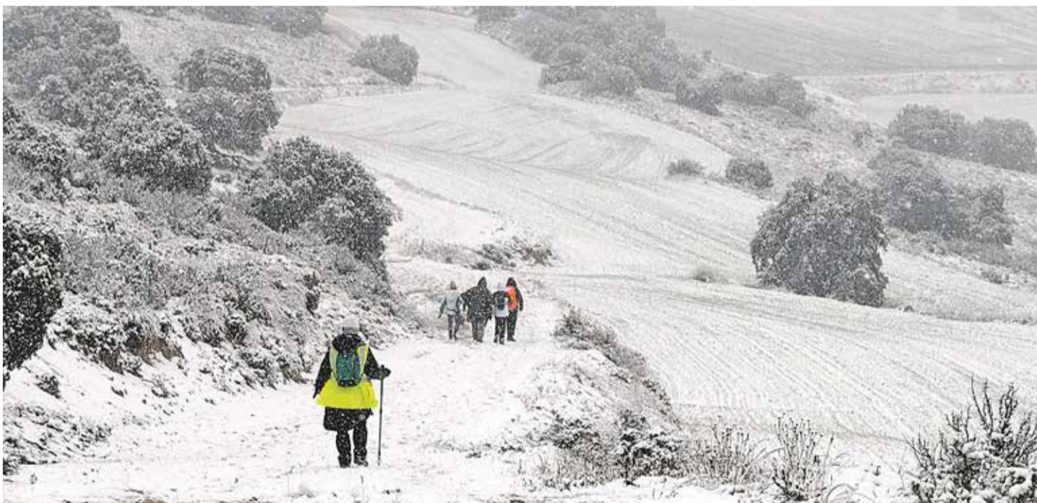
Foto: Marcha Senderista Comarca Campo de Daroca, en Cubel. Deportes Comarca de Daroca

El pasado 16 de marzo, Cubel acogió la XXI-II edición de la Marcha Senderista Campo de Daroca, una cita que este año estuvo marcada