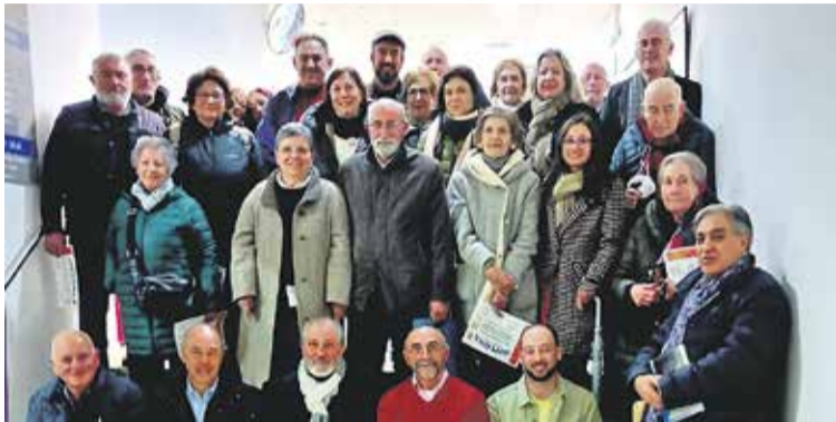
Foto: Foto de familia del.

El ha finalizado con una gran acogida por parte de los asistentes. Organizado por el área de Cultura del Ayuntamiento, ha contado con la dirección del historiador José Luis Corral y ha reunido a más de cuarenta participantes en un programa de once