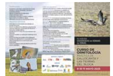
Foto: Curso de Ornitología Gallocanta y las Tierras del Jiloca. Organización del programa formativo Gallocanta y las Tierras del Jiloca