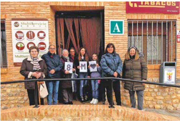
Foto: Conmemoración del 8M en Mainar.

El pasado 8 de marzo, Mainar se unió a la celebración del Día Internacional de la Mujer, con una serie de actividades que promovieron la reflexión y la unidad entre sus habitantes. En este día, que se ha convertido en un símbolo de lucha por la igualdad de género y los derechos de las mujeres en todo el mundo, el Ayuntamiento organizó un evento que incluyó la lectura de un manifiesto, el reparto de marcapáginas con frases inspiradoras y un café con pastas, creando un ambiente cálido y de celebración.