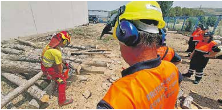
Foto: Curso para el manejo de la motosierra a los voluntarios de Protección Civil, en el Centro de Formación Forestal. CFF Comarca de Daroca

El próximo 9 de abril de 2025, el IES Zaurín celebrará su tradicional jornada de puertas abiertas de Formación Profesional, en la que se dará a conocer la oferta educativa del centro en este ámbito. El evento tendrá lugar de 11:00 a 13:00 horas y estará dirigido a estudiantes, familias y cualquier persona interesada en los ciclos formativos impartidos.