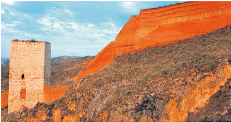
Ruta de las Murallas de Daroca.

El municipio de Daroca ha alcanzado el 57,51% de ejecución en las obras del Plan de Sostenibilidad Turística en Des-