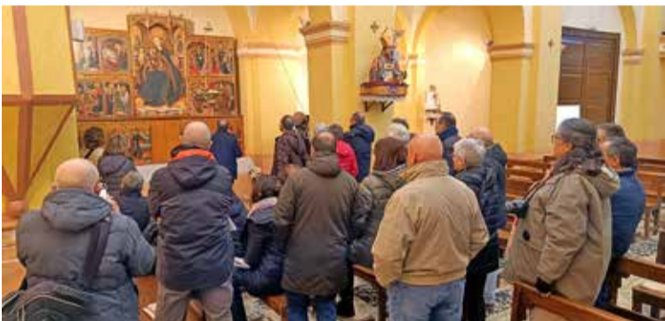
Foto: Visita a Retascón.

El pasado domingo 23 de marzo, concluyó el curso de extensión universitaria sobre "Bartolomé Bermejo y la Pintura Gótica de la Comarca del Campo de Daroca", organizado por la UNED de Calatayud con la colaboración de la Consejería de Patrimonio Cultural de la Comarca Campo de Daroca.