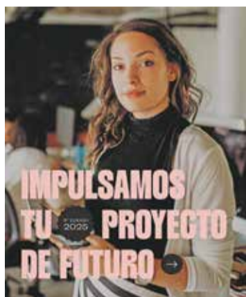
Foto: IX GIRA Mujeres. Coca Cola y Alma Natura

La Gira Mujeres Coca-Cola está de vuelta. Esta iniciativa, promovida también por Alma Natura, persigue el objetivo de impulsar y afianzar el futuro profesional de las mujeres rurales. En su octava edición, pretende seguir ayudando al funcionamiento de sus negocios, que contribuyen a la resolución de problemas sociales y ambientales en sus municipios, y a la generación de nuevas oportunidades.