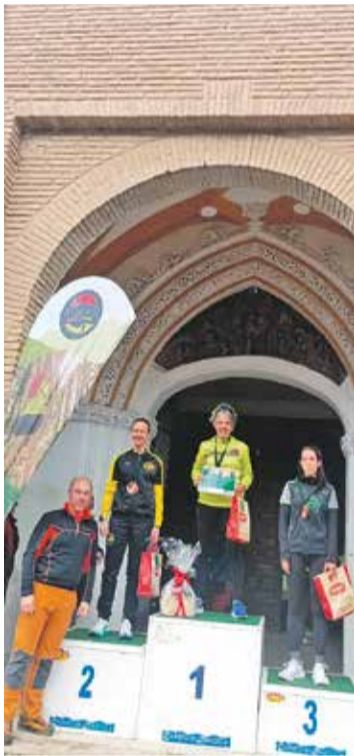
Foto: Podio femenino y masculino de la Daroca Trail. Daroca Trail

El pasado 9 de marzo dio comienzo la segunda edición de la Copa Ibérica Trail con la celebración de la Daroca Trail. Este torneo, que engloba tres pruebas en la Comarca Campo de Daroca -Daroca Trail, Trail Ibérica Used, el 30 de marzo, y Desafío