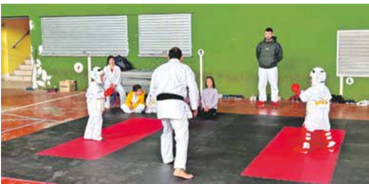
Foto: I Evento de Artes Marciales de Cubel

El pasado 2 de marzo, el Pabellón de Cubel fue escenario de un evento sin precedentes en la comarca, organizado por el Club de Lucha Dojo Heian Raposo. Una jornada repleta de emoción y espectáculo, donde jóvenes ta-