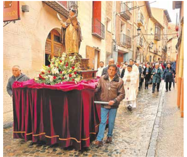
Foto: Procesión en honor a Santo Tomás de Aquino. Comarca Campo de Daroca