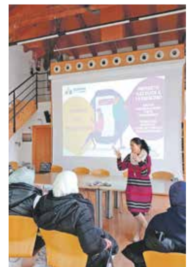
Foto: Curso para el manejo del smartphone. Haz click a la igualdad