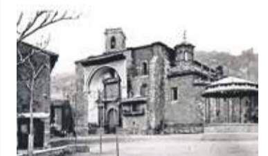
Foto: Antiguo kiosko de Daroca.