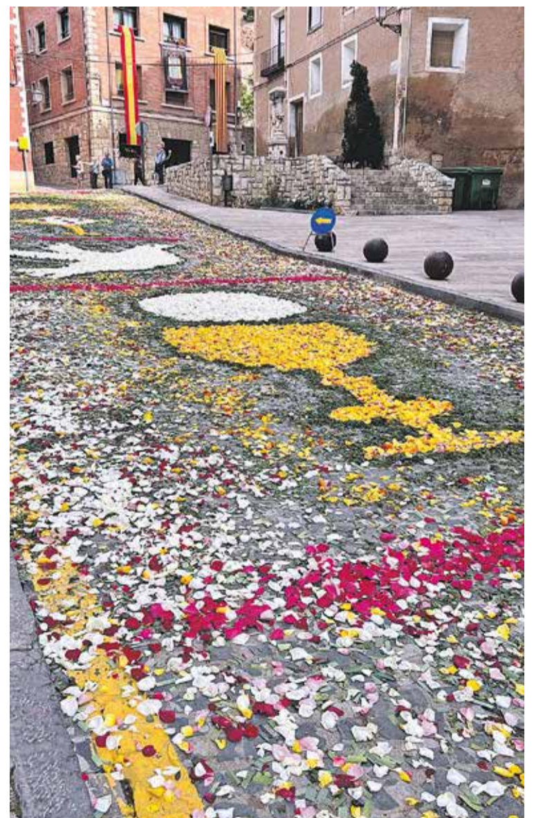
Foto: Alfombra floral del Corpus Cristi 2023. Radio Comarca de Daroca