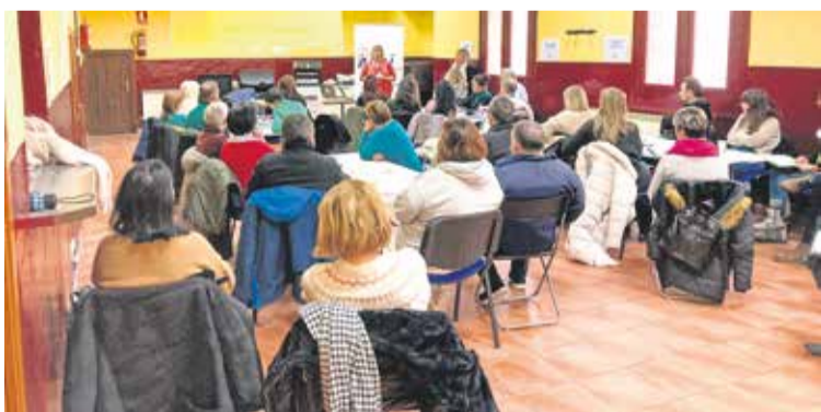
Foto: Éxito de participación en el último evento de Rural Jump Start. Adri Jiloca. Gallocanta.

El proyecto europeo Erasmus+ Rural Jump Start, coordinado por el grupo de Acción Local Adri Jiloca-Gallocanta, llegó a su fin con la celebración de un evento en Báguena, en el que se