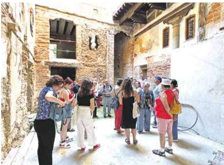
Foto: Visita de estudiantes de la UNED al Palacio de los Luna en Daroca. María Pilar Redondo