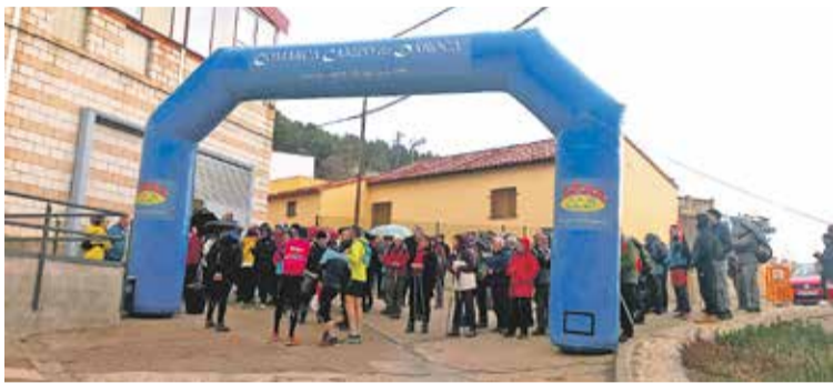
Foto: Los andarines, a punto de hacer su salida en Manchones. Deportes Comarca de Daroca

● Más de un centenar de personas acudieron a la cita para redescubrir parajes como el Barranco de la Pimienta