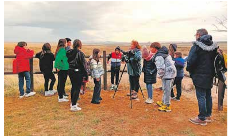
Foto: Visita del CIA de la Comarca Campo de Daroca a la Laguna de Gallocanta. Rubén Sanz