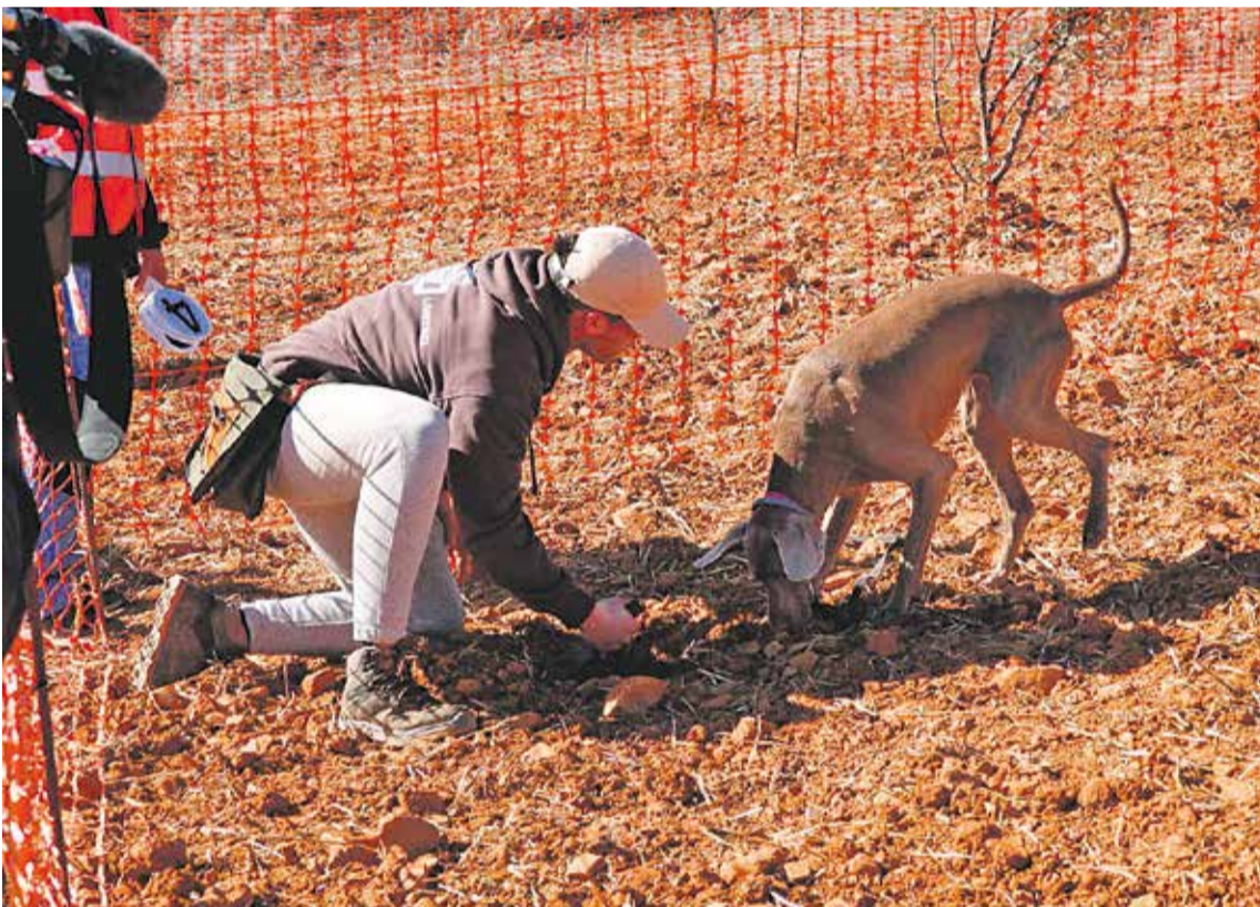
Foto: IV Concurso Nacional de Caza de Trufa de la Comarca Campo de Daroca. Turismo Comarca de Daroca

La Comarca Campo de Daroca ha cerrado con gran éxito las inscripciones de su quinto Concurso Nacional de Caza de Trufa, que se celebrará los próximos 10 y 11 de febrero en la localidad de Villarroya del Campo: se ha aumentado casi un 52% el número de inscritos respecto al año pasado.