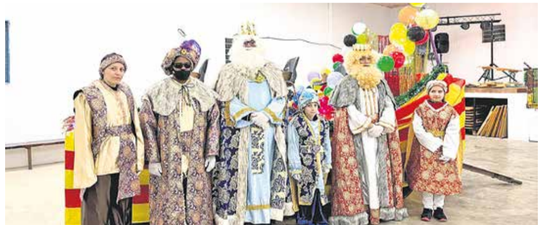
Foto: Los Reyes Magos de Oriente, en Mainar . Ayuntamiento de Mainar