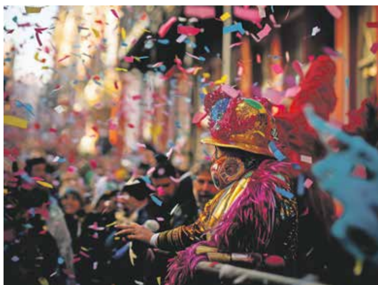
Foto: Se acerca la Fiesta de Carnaval a Daroca.

El Ayuntamiento de Daroca convoca, un año más, el concurso del Cartel Anunciador del Carnaval, en colaboración con el