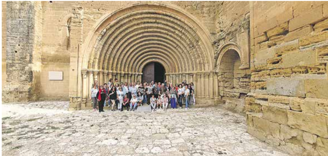
Foto: Así despedía el alumnado del CPEPA Daroca el Curso 2022-2023