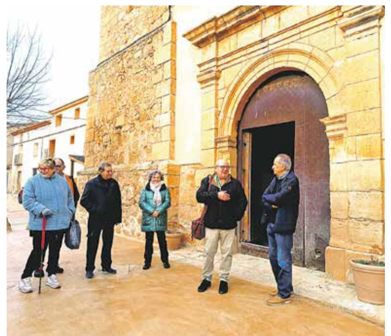
Foto: Última visita de 'Las llaves de nuestro patrimonio 2023'. Patrimonio Comarca de Daroca