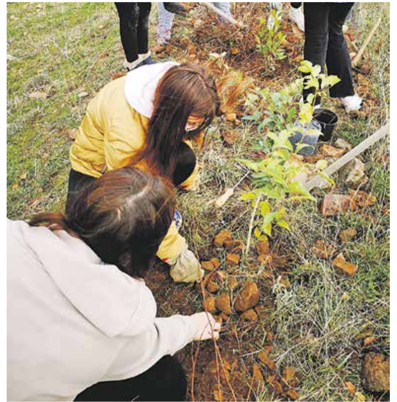
Foto: Jóvenes voluntarios de la Comarca llevan a cabo tareas de reforestación en Cerveruela.