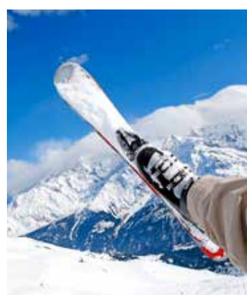
Foto: Jornadas Esquí Escolar 2024.