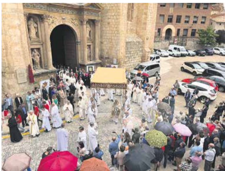
Procesión del Corpus Christi 2023.

Los vecinos y vecinas de Daroca y de la Comarca pudieron disfrutar, en exclusiva, del visionado de 'Daroca, ciudad custodia de los Sagrados Corporales'. El vídeo, que fue también presentado en Fitur, la feria del