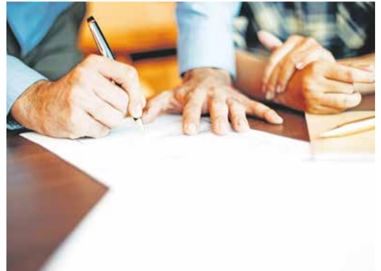
Foto: Subvenciones a Asociaciones de la Comarca Campo de Daroca.