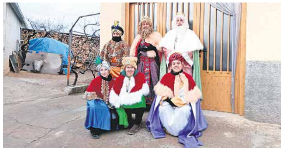
Foto: Los Reyes Magos, a su paso por Villanueva de Jiloca. Unidad Pastoral de Daroca.