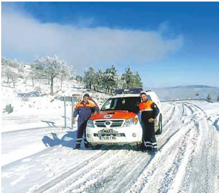
Foto: Dos voluntarios de protección civil posan en una de las vías intercomarcales teñidas de blanco.

La borrasca Juan trajo, el pasado 19 de enero, la nieve a la Comarca Campo de Daroca, tiñendo de blanco sus municipios.