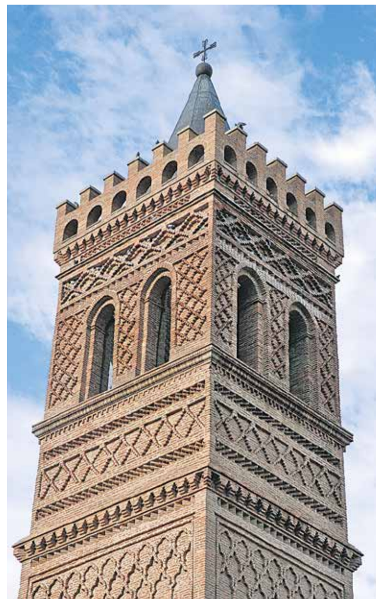
Foto: Torre mudéjar de la Iglesia de San Juan Bautista de Herrera de los Navarros. Turismo de Aragón