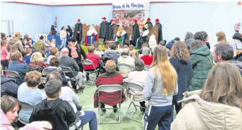
Foto: Los Reyes Magos de Oriente se acordaron de los vecinos de Herrera de los Navarros. Ayuntamiento de Herrera