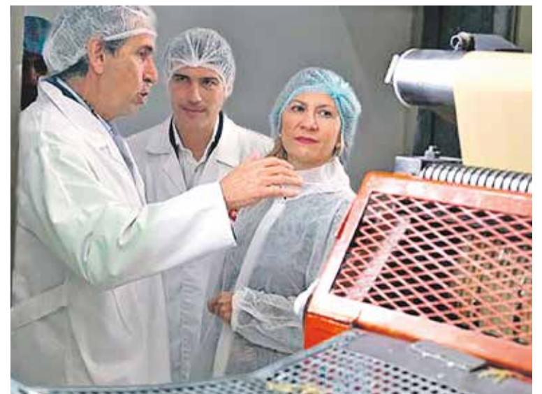
Foto: Mar Vaquero pudo conocer la planta de Pastas Romero al completo. Fabián Simón