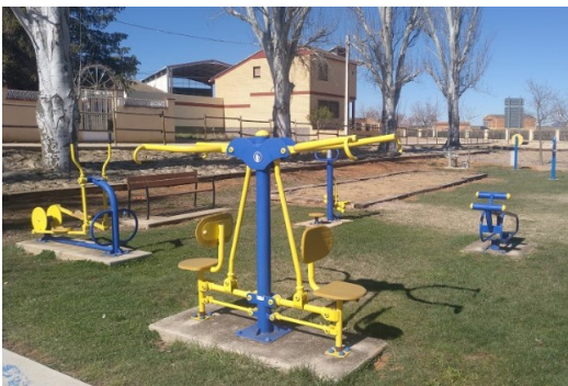
4 y 5