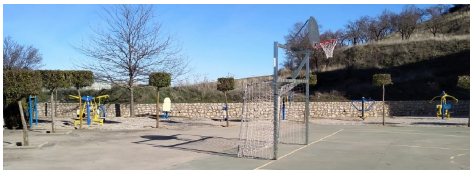
5 y 6