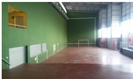
1 y 2