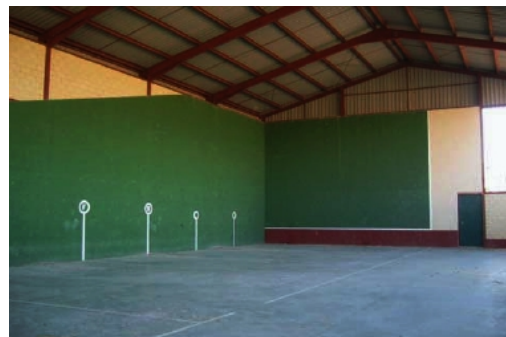
1, 2 y 3