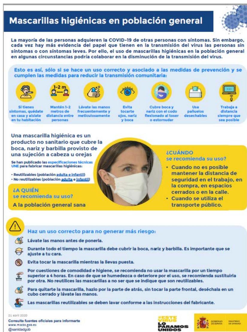
Mascarillas higiénicas en población general (Ministerio de Sanidad, 2020)

Nota: las mascarillas quirúrgicas y las mascarillas higiénicas no son consideradas EPI.