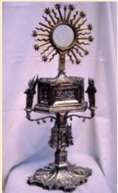
Villanueva. Custodia. Siglo XVI