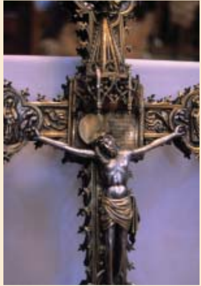
Villanueva. Cruz procesional. Siglo XVI