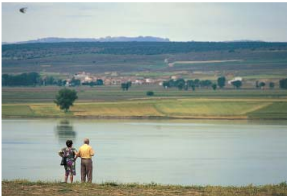
Laguna de Gallocanta

Las fotografías, en su mayor parte, son de Julio Foster, gran profesional y amante de nuestra tierra. Se completan con algunas de los propios autores y del coordinador quien ha aprovechado, cuando ha sido necesario, su archivo de diapositivas realizado en 1999, a la vez que revisaba el Inventario Artístico del Partido Judicial de Daroca.