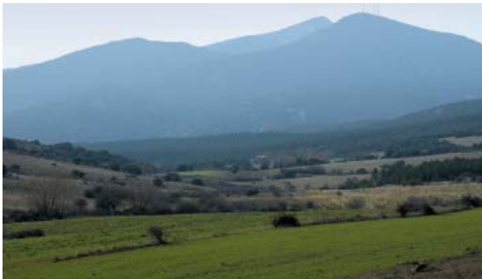
Sierra de Peco

A partir de este momento se fueron creando una serie de servicios e infraestructuras comunes que han dado lugar a una mejor calidad de vida, desde infraestructuras viarias, pasando por servicios como el de recogida de residuos sólidos y su