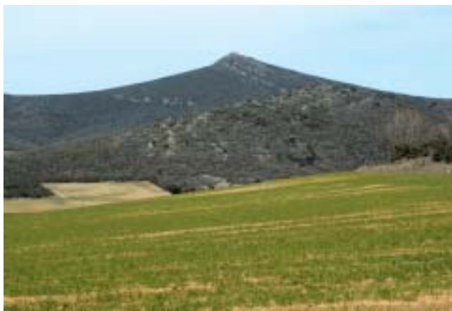
Sierra de Santa Cruz

Y en el centro de este territorio largo y estrecho, de este a oeste, o