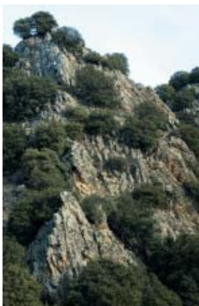
Monte de San Bartolomé

En este punto en el que nos encontramos se abre ante nosotros una nueva forma de organización supramunicipal: la Comarca, la cual se caracteriza por una descentralización a favor de nuestro propio autogobierno.